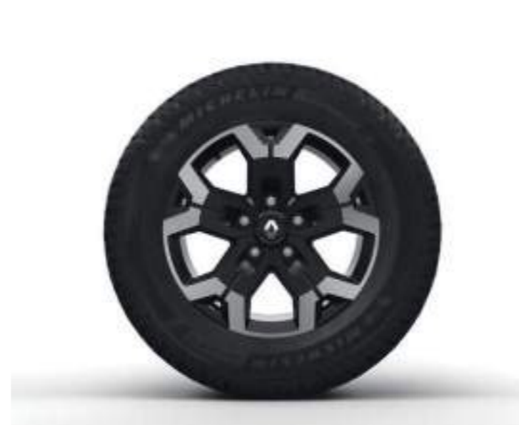
llanta de 16" de aleación diamantada