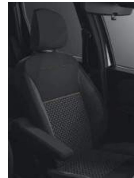
Emotion 1.6 Sce