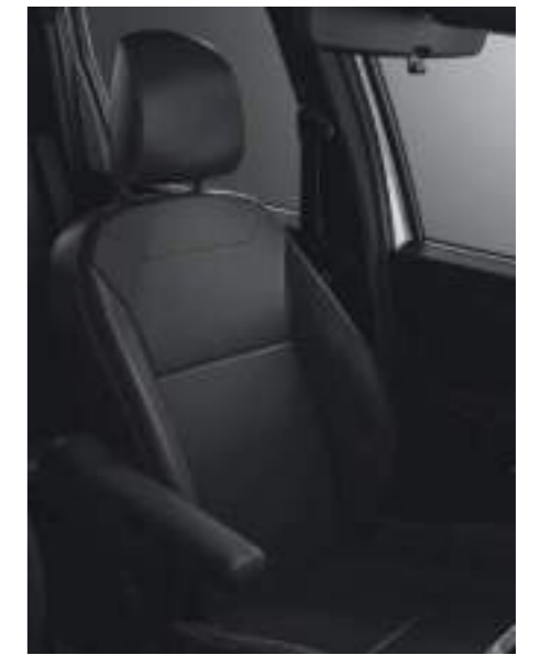
Iconic 1.3 TCe CVT/Outsider 1.3 TCe 4WD