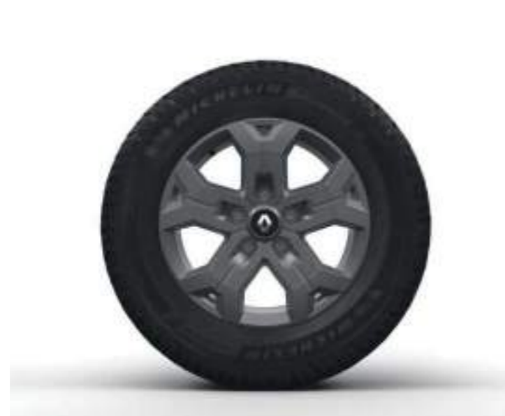
llanta de 16" de aleación