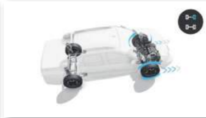
CONTROL DE TRACCIÓN (TCS)