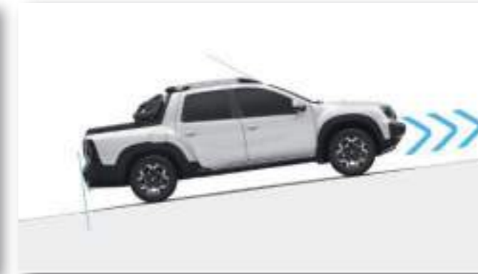
ASISTENTE DE ARRANQUE EN PENDIENTE (HSA)