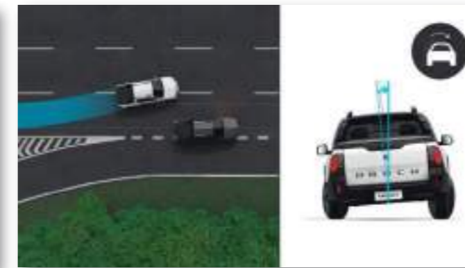
SISTEMA DE ROLLOVER MITIGATION (ROM)