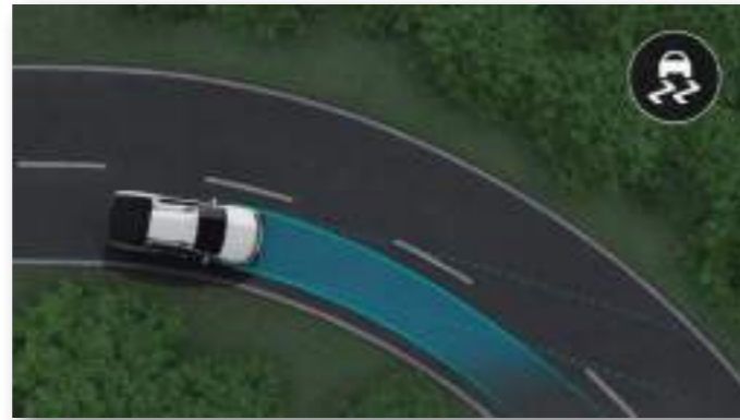
CONTROL DE ESTABILIDAD (ESP)

la nueva Renault Oroch cuenta con control de estabilidad y tracción (ESP y TCS) para una mayor seguridad y estabilidad, incluso en situaciones de baja adherencia. Además, cuenta con asistencia de arranque en pendiente (HSA) que facilita automáticamente la salida en ascensos pronunciadas y un nuevo sistema de mitigación de vuelcos (ROM y RMI).