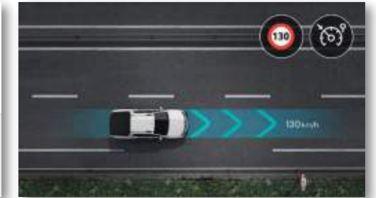
CONTROL DE VELOCIDAD CRUCERO