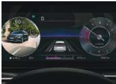
Monitor de Punto Ciego