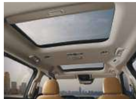
Doble Techo Solar