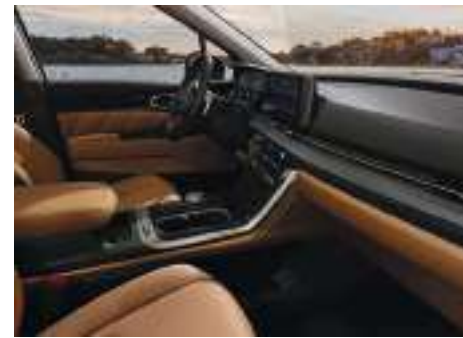
Asientos Calefaccionados y Ventilados