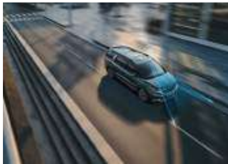
Drivewise - Ayudas a la Conducción