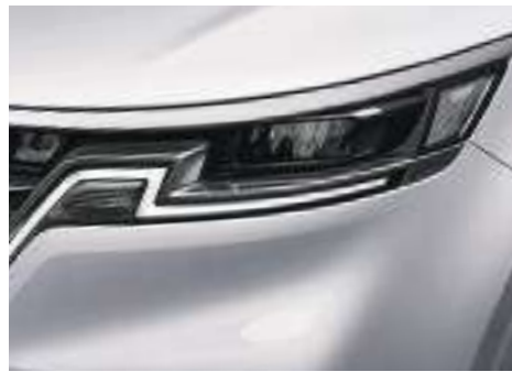
Faros Full LED