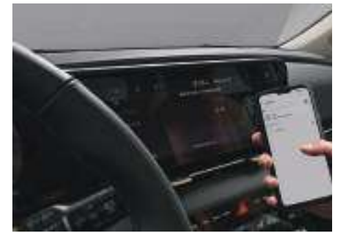
Central Multimedia de 12.3