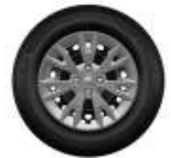
Llanta de aleación 15"