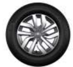
Llanta de aleación de 15''