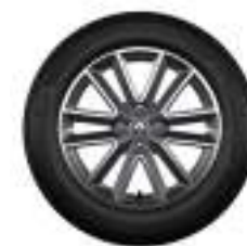
Llanta Diamantada de 16"