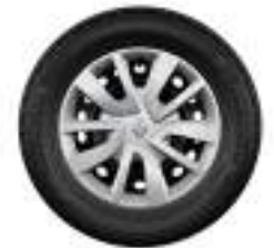
Llanta de aleación de 15"