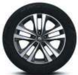
Llantas Aleación bitono 18" (225/60)

Apoyacabezas delanteros con posibilidad de ajustar inclinación y posición superior-inferior Asientos delanteros con comando eléctrico de 6 direcciones (con ajuste lumbar para el conductor) Asiento trasero con Easy Touch Folding Climatizador bizona con salida trasera de aire Control del aire acondicionado a través de la pantalla táctil Espejo retrovisor interior electrocrómico Espejos retrovisores exteriores con comando eléctrico, calefaccionados Freno de mano eléctrico Replicación de Smartphone en pantalla táctil: Apple CarPlay y Android Auto Sistema de estacionamiento asistido de 4 direcciones (paralelo, perpendicular, diagonal y salida paralela) Sistema R-Link 2 con pantalla táctil de 8,7" y navegador satelital integrado Sonido Bose® con amplificador, 4 parlantes, 4 tweeters, 2 parlantes envolventes, subwoofer y altavoz central Tarjeta llave y botón de arranque "Keyless Start" Techo panorámico con comando eléctrico Volante ajustable en altura y profundidad